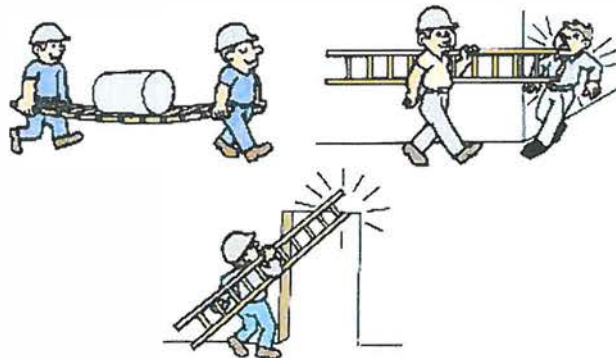
Formas incorrectas de transportar escadas